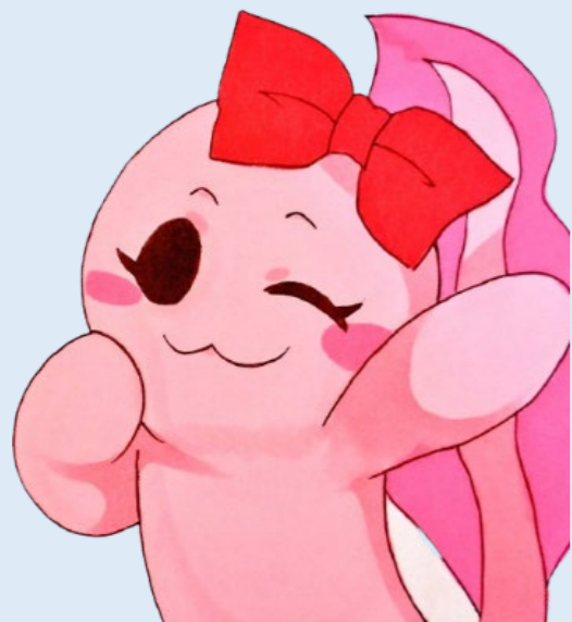
(写真上) だいふくさんの代表作であるパールちゃん

注) 花園教会水族館とは、花園キリスト教会が運営する私設水族館。京都市内博物館施設連絡協議会(京博連)加盟施設で、NCM ジャパン京都事務所とは人権・環境の観点から相互に交流がある